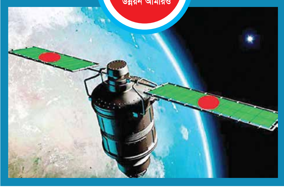
বঙ্গবন্ধু স্যাটেলাইট-১ : বাংলাদেশের মালিকানাধীন প্রথম কৃত্রিম উপগ্রহ

বঙ্গবন্ধু স্যাটেলাইট-১ বাংলাদেশের প্রথম ভূস্থির (Geostationary) যোগাযোগ ও সম্প্রচার উপগ্রহ। এর মধ্যে দিয়ে ৫৭ তম দেশ হিসেবে নিজস্ব স্যাটেলাইট উৎক্ষেপণকারী দেশের তালিকায় যুক্ত হয় বাংলাদেশ। এটি ১১ই মে ২০১৮ যুক্তরাষ্ট্রের কেনেডি স্পেস সেন্টার থেকে উৎক্ষেপণ করা হয়। এটি ছিল ফ্যালকন ৯ ব্লক-৫ রকেটের প্রথম পেলোড উৎক্ষেপণ। এটি ফ্রান্সের থেলিস অ্যালেনিয়া স্পেস কর্তৃক নকশা ও তৈরি করা হয়েছে। বঙ্গবন্ধু স্যাটেলাইট-১, ১৬০০ মেগাহার্টজ ক্ষমতাসম্পন্ন মোট ৪০টি কে-ইউ এবং সি-ব্যান্ড ট্রান্সপন্ডার বহন করছে এবং এর আয়ু ১৫ বছর। এর নির্মাণ ব্যয় প্রায় তিন হাজার কোটি টাকা। বর্তমানে স্যাটেলাইটের ব্যান্ডউইথ ও ফ্রিকোয়েন্সি ব্যবহার করে ইন্টারনেট বন্ধিত অঞ্চল যেমন- পার্বত্য ও হাওড় এলাকায় ইন্টারনেট সুবিধা প্রদান করা সম্ভব হচ্ছে, প্রত্যন্ত অঞ্চলে ইন্টারনেট ও ব্যাংকিং সেবা, টেলিমেডিসিন ও দূরশিক্ষণ ব্যবস্থা প্রসারেও এটি ব্যবহৃত হচ্ছে। টিভি চ্যানেলগুলো তাদের সম্প্রচার সঠিকভাবে পরিচালনার জন্য বিদেশি নির্ভরতা কমিয়ে এর উপর নির্ভর করছে। ফলে দেশের টাকা দেশেই থাকছে। বড় প্রাকৃতিক দুর্যোগের সময় মোবাইল নেটওয়ার্ক অচল হয়ে পড়লে এর মাধ্যমে দুর্গত এলাকায় যোগাযোগ চালু রাখা সম্ভব। শুধু তাই নয় শেখ হাসিনা সরকারের বর্তমান মেয়াদেই বঙ্গবন্ধু স্যাটেলাইট-২ মহাকাশে উৎক্ষেপণেরও উদ্যোগ নেওয়া হবে। বঙ্গবন্ধু ১৯৭৫ সালের ১৪ই জুন বেতবুনিয়ায় ভূ-উপগ্রহ কেন্দ্র স্থাপনের মাধ্যমে যে স্বপ্নের বীজ বপন করেছিলেন, সেই স্বপ্ন মহীরুহে পরিণত করেছেন প্রধানমন্ত্রী শেখ হাসিনা।